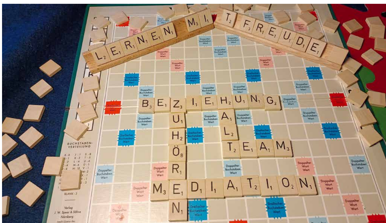
Abb. 1: Beziehungsarbeit mittels Mediation.

Damit die Schule ein Ort sein kann, wo Lernen mit Freude stattfindet, braucht es Lehrkräfte und Sozialpädagogen, ein gesamtes Team an reflektierten Menschen, die bereit sind, Vorbild und Anhaltspunkt für Kinder zu sein.